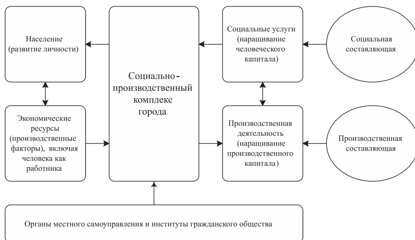
Рис 1. Структура социально-производственного комплекса города

Любая городская система с ее сердцевиной – социально-производственным комплексом – с неизбежностью разрушается, если нарушится устойчивость функционирования этой взаимосвязанной и взаимозависимой совокупности сложноорганизованных компонентов, каждый из которых дополняет друг друга.