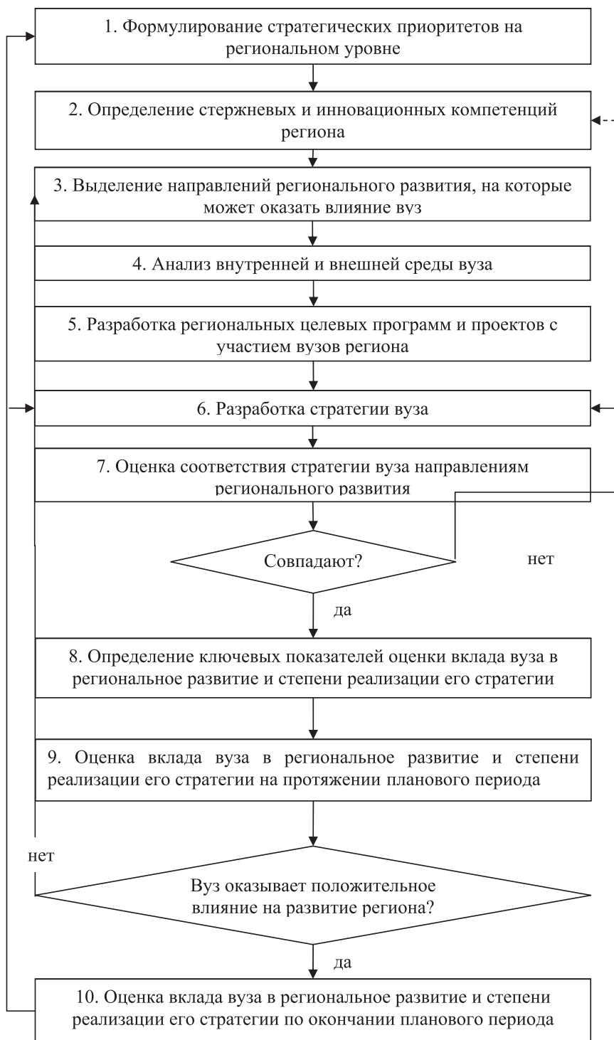
Рис. 2. Механизм взаимовлияния направлений регионального развития и стратегий вузов