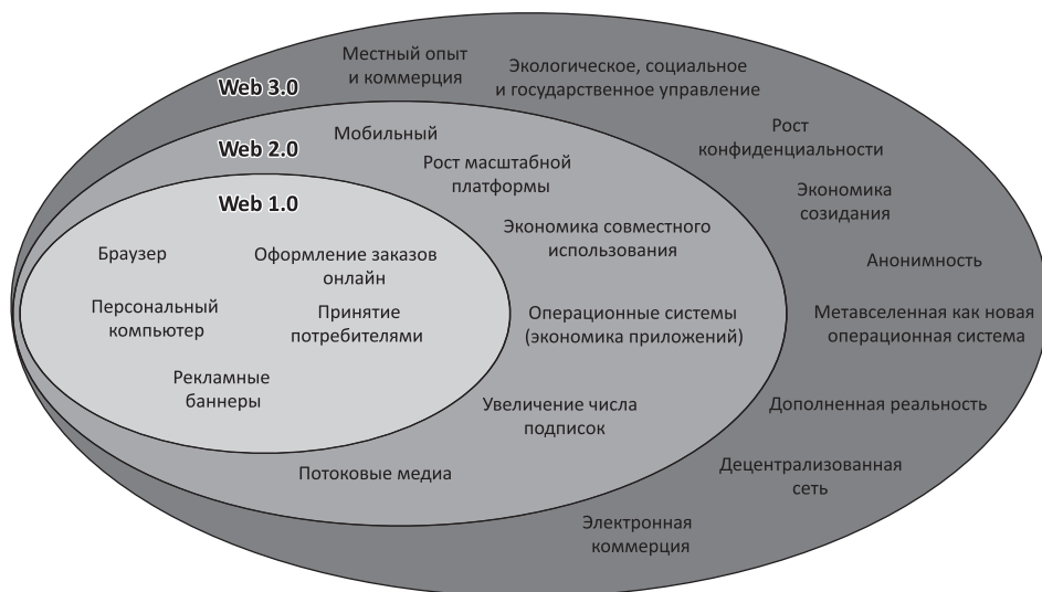
Рис. 1. Эволюция Web-технологий / Fig. 1. Evolution of Web technologies

и открытости. Являясь органичным продолжением и развитием Web 2.0, новая концепция не заменяет предыдущую, а дополняет и расширяет ее новыми возможностями (см. рис. 1). Искусственный интеллект, большие данные, блокчейн, криптовалюта, метавселенные – новые технологии, создающие цифровую реальность. Ряд технологий Web 3.0 относят к категории прорывных, среди которых последние два года особо выделяется метавселенная.